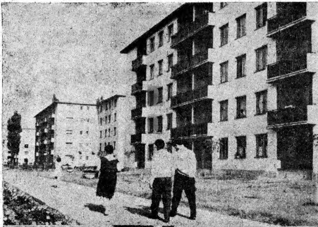
În locul vechilor colonii mizere și insalubre se înalță mîndru orașul renăscut — Vulcan