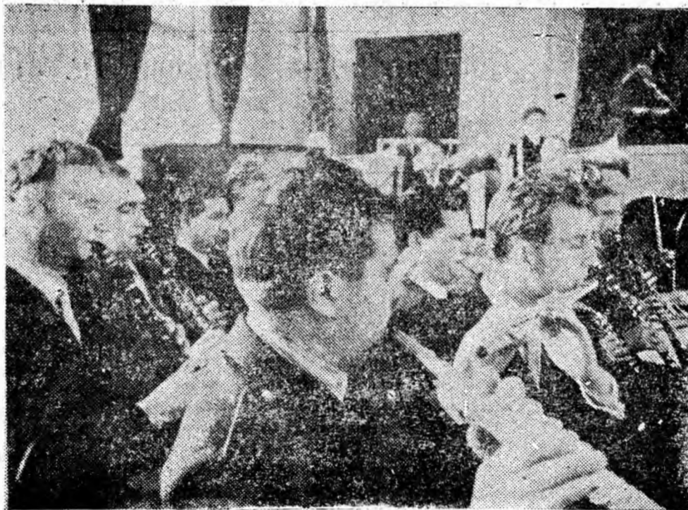
Aspect din timpul unei repetiții a orchestrei simfonice.

tereni, alături de celelalte formații care au ocupat primul loc la faza pe regiuni a celui de-al VII-lea concurs, al for-