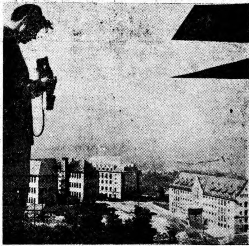
În obiectivul aparatului: Peisaje noi.

480 și 440. Buna organizare a muncii, îngrijirea sculelor, predarea „ștafetelor” de la un schimb la altul la locul de muncă se materializează în metri liniari de avansare. În fiecare lună se înaintează cu cite 55 pînă la 69 de metri, trimițîndu-se la ziua piatra care își intrerupe somnul milenar. Dacă s-ar încălca în vagoane sterilul excavat de brigadă de la începutul anului ar fi nevoie de 300 vagoane! Sarcina brigăzii se realizează lunar în proporție de 130-135 la sută. Angajamentul anual de a excava peste plan 240 m c steril a fost îndeplinit și depășit deja. Nici calitatea nu este neglijată: panta și direcția galeriei se înscriu întocmai în proiect. Oamenii au învățat să folosească cu iscusință tehnica modernă — mașina de încărcat de tipul E.P.M.-2 și apoi, un reincărcător cu bandă. Le-au venit în ajutor