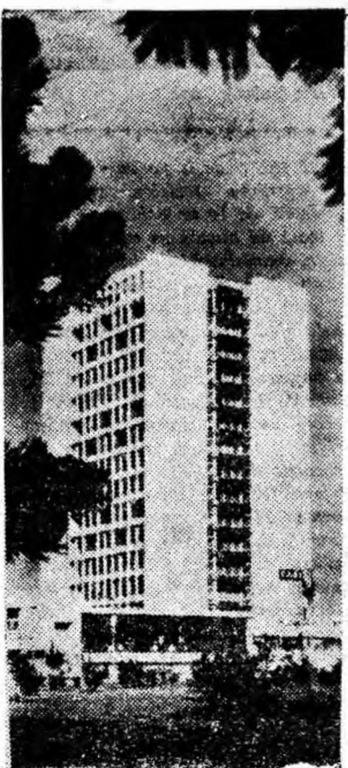
Frumusețe și semeție — iată ce caracterizează întregul litoral. IN GIȘEU: Un hotel din Mamaia.

Astfel, de pildă, în statul Oklahoma este interzisă vînătoarea în parcurile orașului. În Illinois este interzis clienților să doarmă în frizerie. În statul Pennsylvania este interzis ca după miezul nopții caii să mai alerge pe străzi. La Philadelphia este interzis să se arunce pe ferestraș fuste. În statul Florida este interzis sfîrșitul în timpul nopții, iar în orașul Boston este interzis să se facă baie duminică. La Rochester statul New York, este interzis copiilor să traverseze strada omlind pe frînghie. În orașul Nogales, din statul Arizona, este interzis să se folosească bretele în chip de praștie. La Los Angeles este interzis să se țină un hipopotam în apartament.