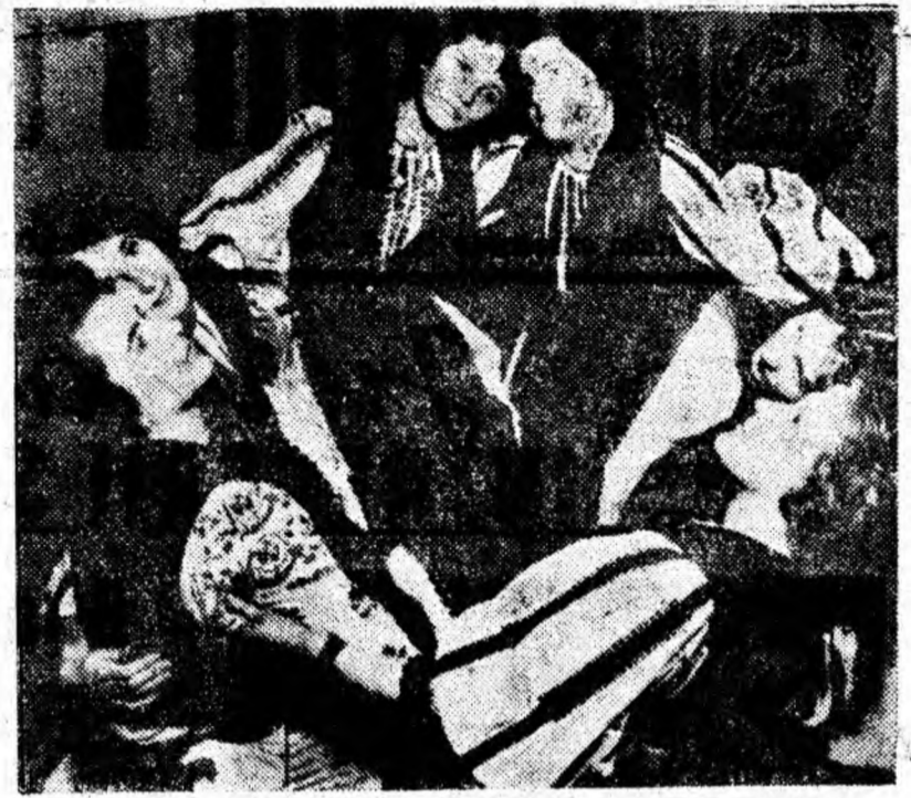
Jocurile și dansurile populare sînt frumoase cum este de fapt și portul național al poporului nostru. Buchetul de fete prins în horă e în deplină armonie cu... frumosul.

În urma propunerilor făcute de oamenii muncii, binevenită a fost