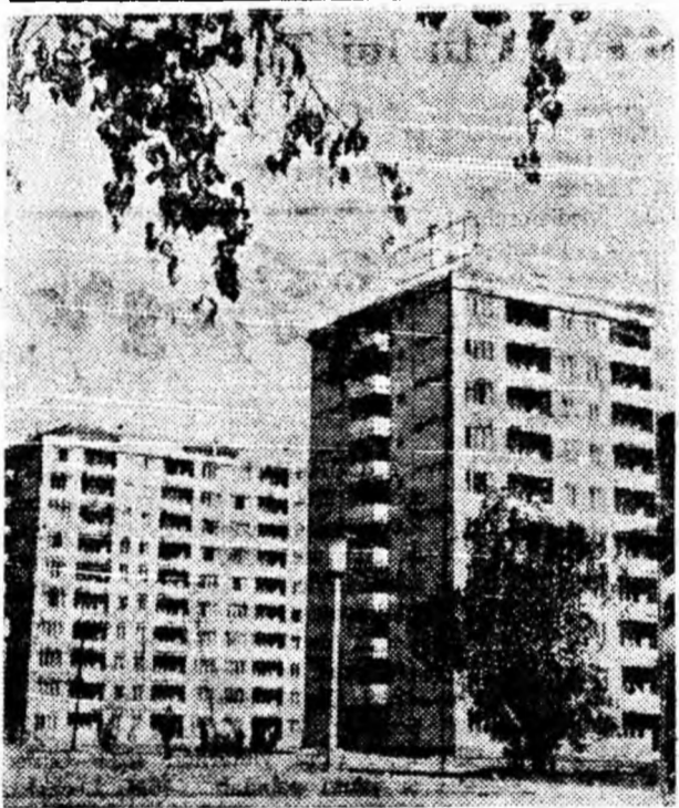
Blocuri turn, cu nouă etaje în orașul nou Hunedoara.

În întîmpinarea marilor sărbători a eliberării patriei, harnicul colectiv al acestei oțelării luptă cu entuziasm pentru a realiza și depăși angajamentele luate. Rodul muncii lui este bogat. În primele șapte luni ale acestui an, el a produs peste plan 54182 tone oțel Martin, de bună calitate. Prin rezultatele obținute în munca, oțelării noii secții se situează în primele rînduri ale luptei pentru împlinirea sarcinilor încredințate de partid.