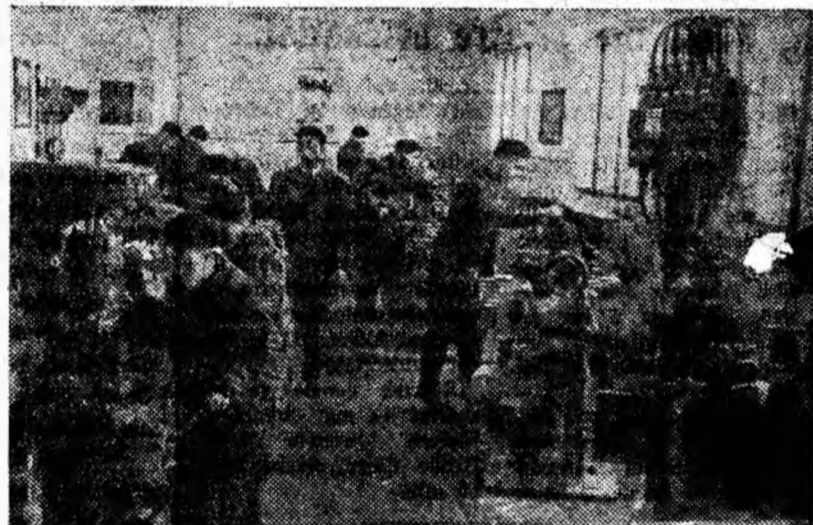
Aspect din atelierul Grupului școlar minier din Petroșani. Sub îndrumarea maestrului instructor, elevii anului I strungari execută lucrări practice.

Mai ales prin caracterul ei de lucru, consfătuirea a constituit o adevărată tribună a experienței înaintate. În cuvîntul lor, toți participanții la discuții și-au exprimat satisfacția de a fi avut prilejul de a lua parte la cea de-a doua consfătuire a cadrelor didactice din învățământul profesional și tehnic minier și energetic.