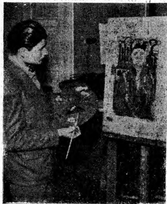
La cercul de artă plastică din Lupeni activitatea se desfășoară cu intensitate. Din culori și din penel, tînărul plastician din fotografie creează o nouă lucrare.