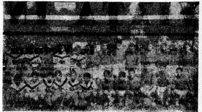
Piticii de la Jiul sînt nu numai colegi de sport ci și de școală. Ei se întrec atît la încălțatură cît și la fotbal. Aceste două activități sudează trainic prietenia.

În lucrare se arată că țara noastră militează pentru desființarea oricăror blocuri militare și, ca o măsură tranzitorie în acest sens, ne declarăm pentru încheierea unui pact de neagresiune între Organizația Tratatului de la Varșovia și Pactul Atlanticului de Nord.