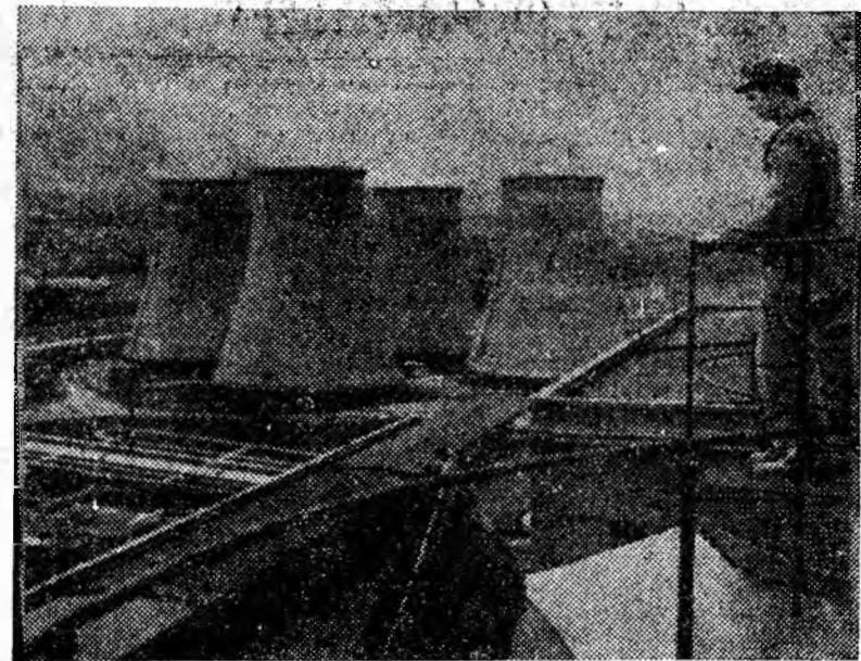
Petroșani. Peisaj nou pe meleaguri vechi.