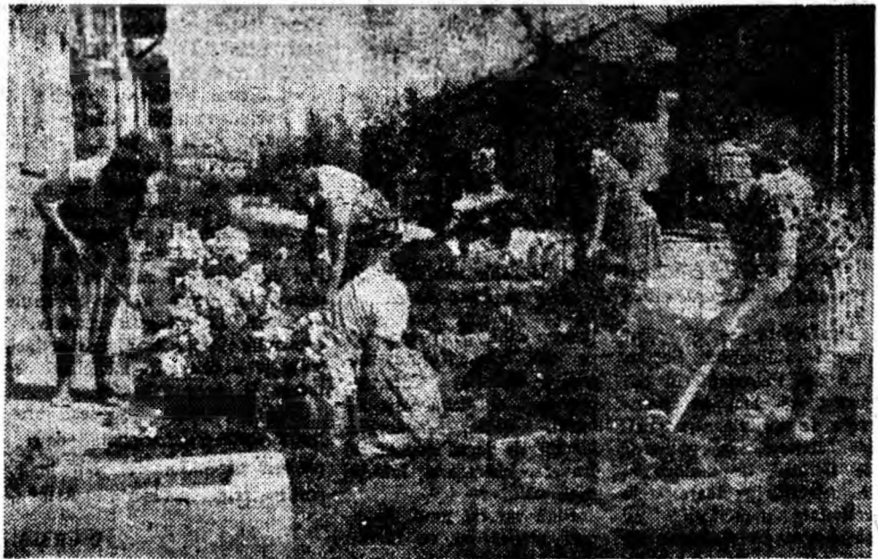
Gospodine hărnicie lucrînd la întreținerea zonelor verzi în cartierul Livezeni din Petroșani.