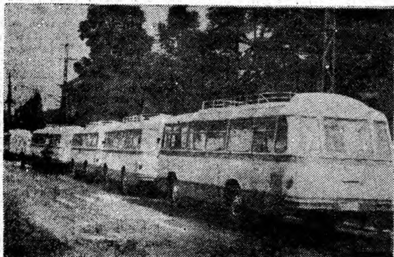
Zilele acestea sosesc la I.R.T.A. Petroșani 20 de autobuze noi, cu care se va asigura transportul muncitorilor mineri de la domiciliu la exploatarea carbonifere.

Timpul scurt, de 2, ore, este folosit cu pricepere de tuneliștii lotului C.F.R. Simeria. Ei reușesc să execute consolidarea tunelului respectiv în termenul prevăzut. După ei, circulația trenurilor se poate desfășura normal!