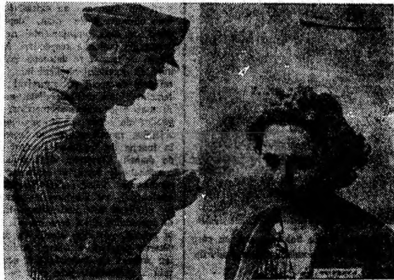
ÎN CLIȘEU: O secvență din filmul „Nu pleca I”.

Filmul sovietic pe ecran lat „Tînărul de pe vasul Columb” redă în imagini de o profundă intensitate dramatică peripețiile celor doi adolescenți porniți pe drumul urmării unui dușman periculos. Ei dau dovadă în această acțiune de multă dirzenie, curaj și eroism. Datorită lor, banda de spioni este prinsă.