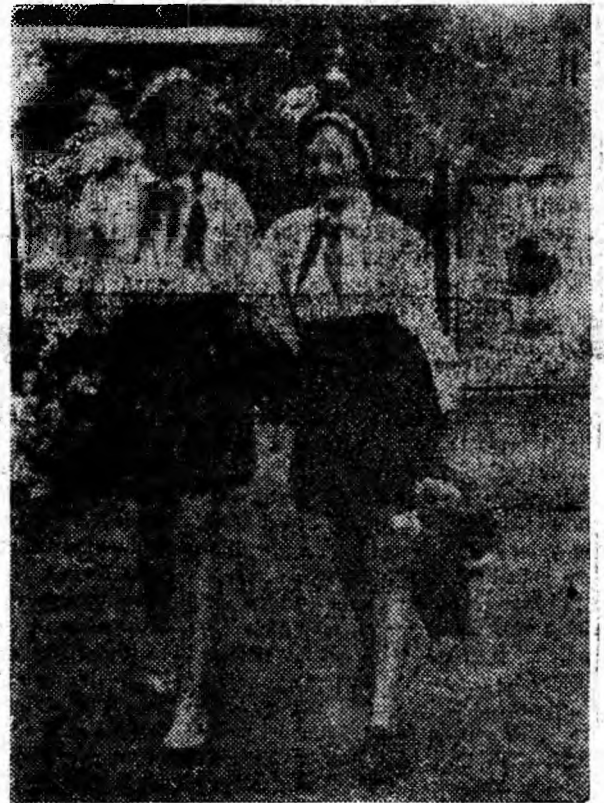
În drum spre școală.