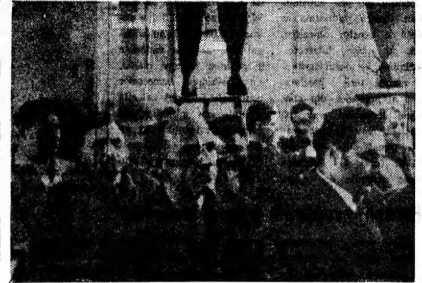
ÎN CLIȘEU: Aspect din sală de la deschiderea universității tehnice.

Pentru expunerea conferințelor au fost desemnate cadre de specialiști din cadrul C.C.V.J., Stației de securitate, Institutului de mine, precum și din cadrul M.M.E.E., IPROMIN