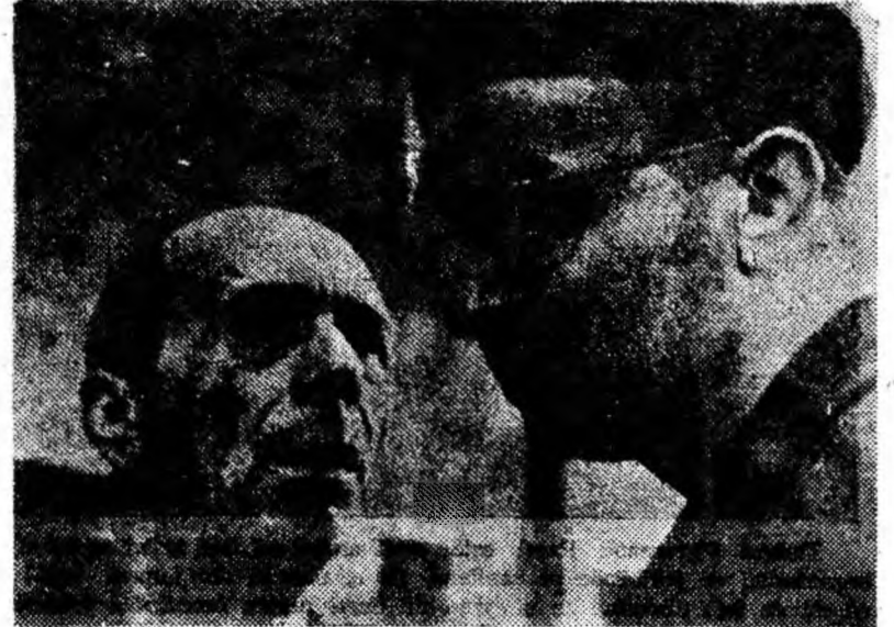
IN CLIȘEU: Un cadru din filmul „Gol printre lupi”.

Salvarea unui copil nevinovat și lipsit de apărare a însemnat o luptă pe viață și pe moarte. Comuniștii și-au dat seama de pericolul nou, de