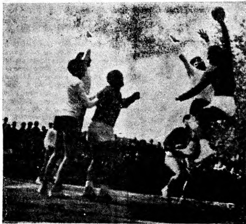
ÎN CLIȘEU: Fază de atac la poarta studenților petroșăneni.

Imediat după începerea reprizei a doua, majorăm scorul la 11—6 prin Koel. Apoi oaspeții atacă susținut și cu toate că marcăm și noi ei re-duc treptat, treptat din handicap. În minutul 44 de joc scorul este egal, 15—15. Conducem cu 16—15, ca apoi echipa din Tg. Mureș să egaleze din nou și să preia conducerea cu 17—16. Egalăm din nou, dar apoi sîntem conduși cu 18—17, 19—17, 20—18, 20—19, 21—19. să egalăm și să obținem punctul victoriei în ultimele secunde de joc. A fost un final dramatic ce a țînat sub tensiune sînt pe jucători cît și pe spectatori.