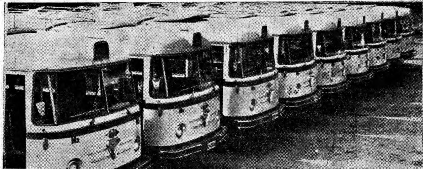
Frumoase autobuze! Noi, moderne, de producție romînească, lotul de 15 autobuze T. V. așteaptă în curtea I.R.T.A. Petroșani plecarea în cursă.

GH. BRĂTESCU GH. FLOREA (transmis prin Agerpres)