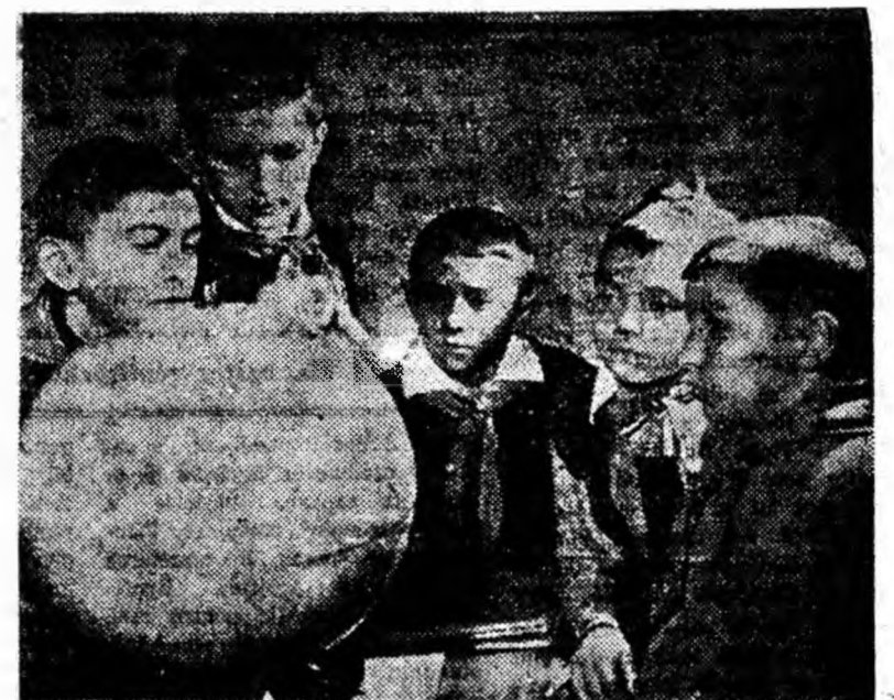
Elevii sînt în plină activitate. Pe cîțiva din clasa a IV-a de la Școala generală de 8 ani nr. 4 Petroșani fotoreporterul nostru i-a surprins în fața „globului pămîntesc” înainte de a intra învățătorul la ora de geografie.