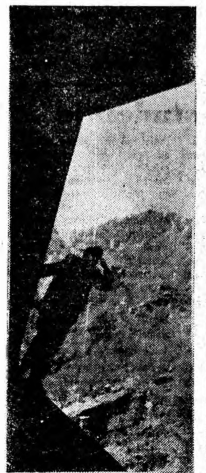
Admirînd frumusețile naturii și giganticele lucrări făurite de om pe defileul Jiului.

„Domnule doctor, puteți să-mi spuneți cum vă îmbrăcați paltonul atunci cînd nu este nimeni în apropiere să vă ajute?”