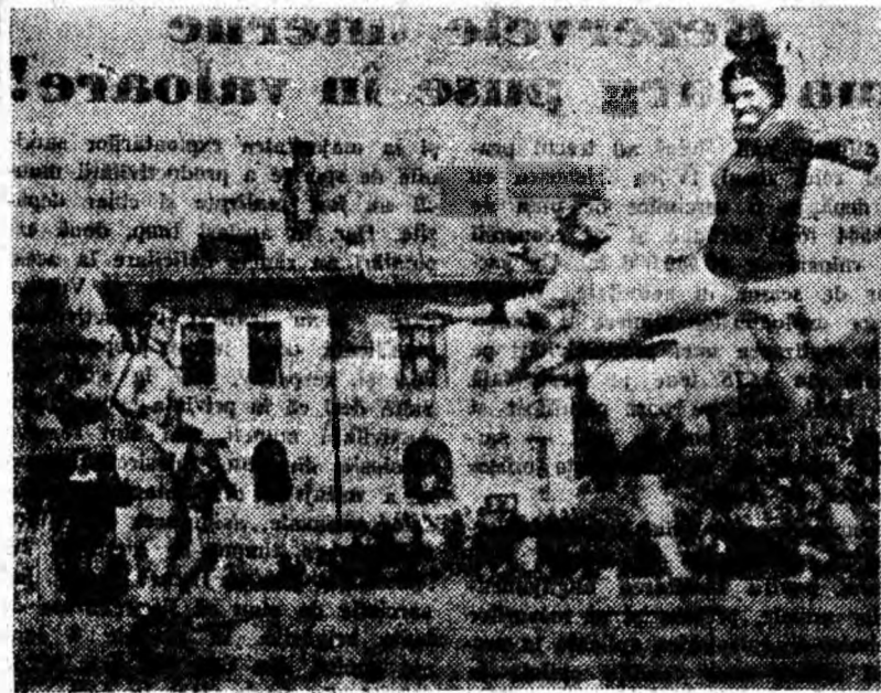
Atac la poarta noastră.

Zăstrea de un gol s-a dovedit însă insuficientă. La reluare oaspeții egaleză și conduce cu 6-5. Egalăm și conducem apoi cu 7-6 dar sîntem