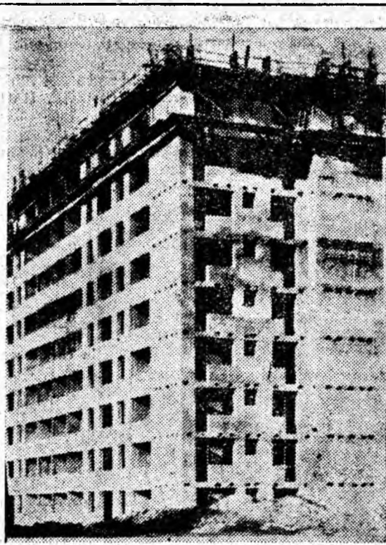
Al treilea bloc ridicat cu ajutorul cofrajului glisant din orașul Vulcan.

Spectatorii petroșăneni prezenți în număr mare la premieră au apreciat jocul actorilor aplaudîndu-i în repetate rînduri la scenă deschisă pentru nivelul înalt de interpretare.