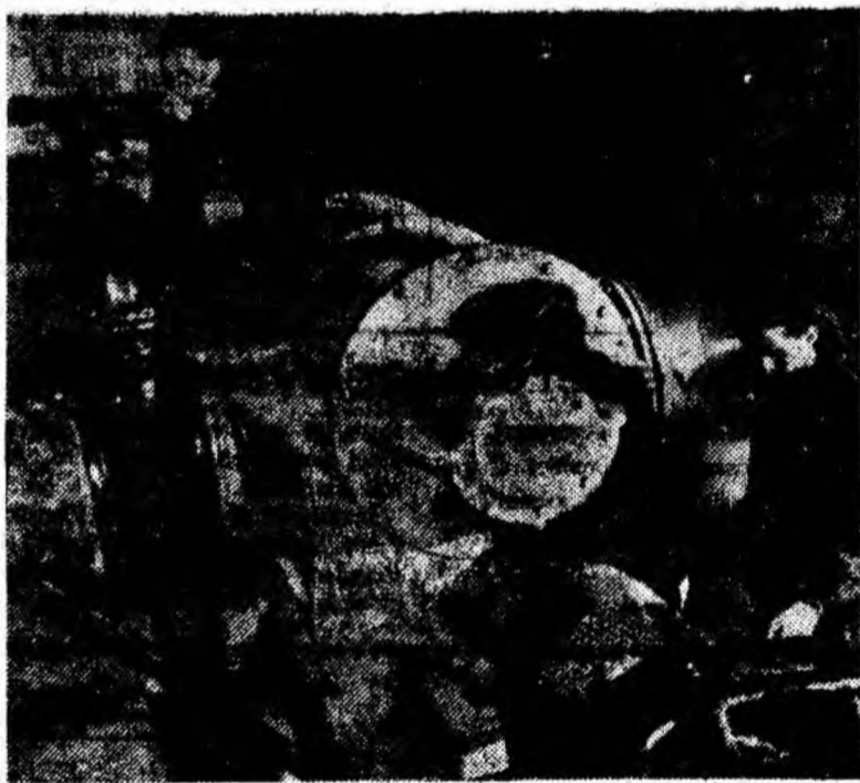
De curînd, la secția flotație de la preparăția cărbunelui din Lupeni s-a terminat montarea sulfantei nr. 2 (în fotografie).

Acum, după începerea noului an de învățământ, cînd activitatea școlii se desfășoară din plin, organizația de bază trebuie să ia măsuri pentru îmbunătățirea muncii de primire în partid.