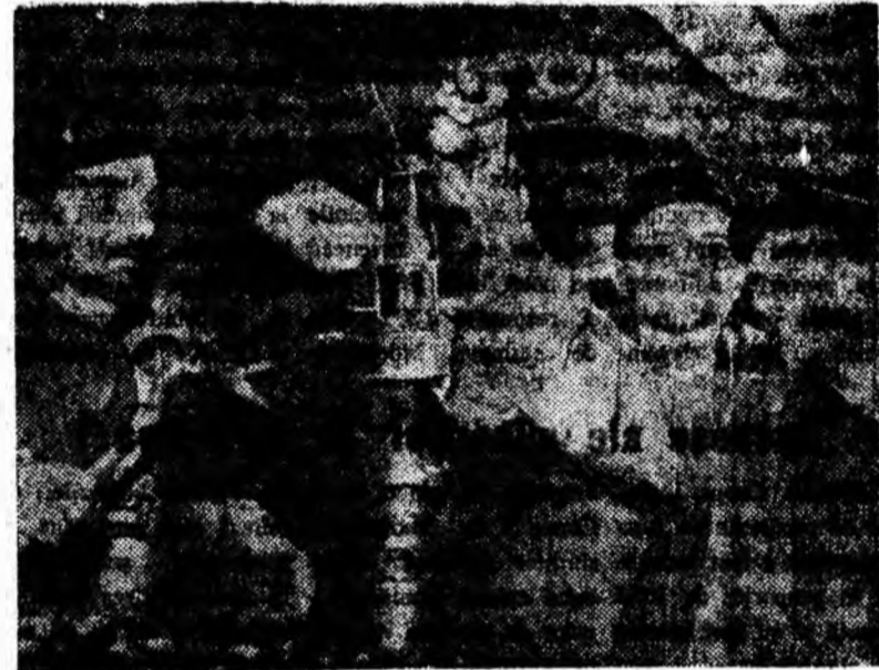
În abatajul frontal mînerii ridică grinza în consolă.

corespunzătoare și împingătoare mecanice pentru deplasarea acestora fără demontare, în condițiile folosirii ginzilor în consolă; dotarea brigăzilor cu perforatoare percutante și rotative în cazul variațiunii durității carbunelui pe grosimea stratului; utilizarea combinelor și plugurilor de carbune în limitele dotării, acolo unde condițiile zăcămintului permit