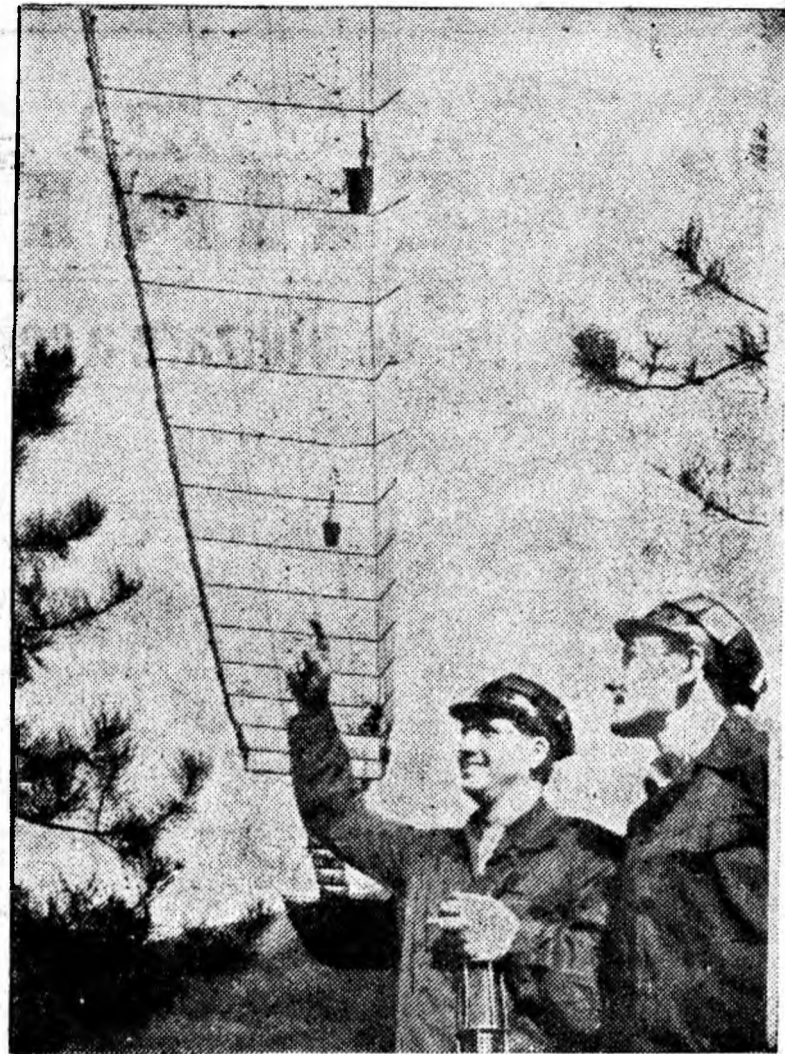
Pe aici trece cărbunele!