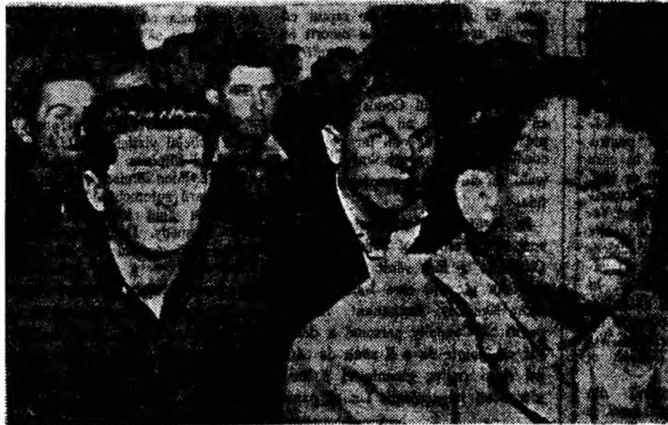
Un aspect din sală în timpul consfătuirii.