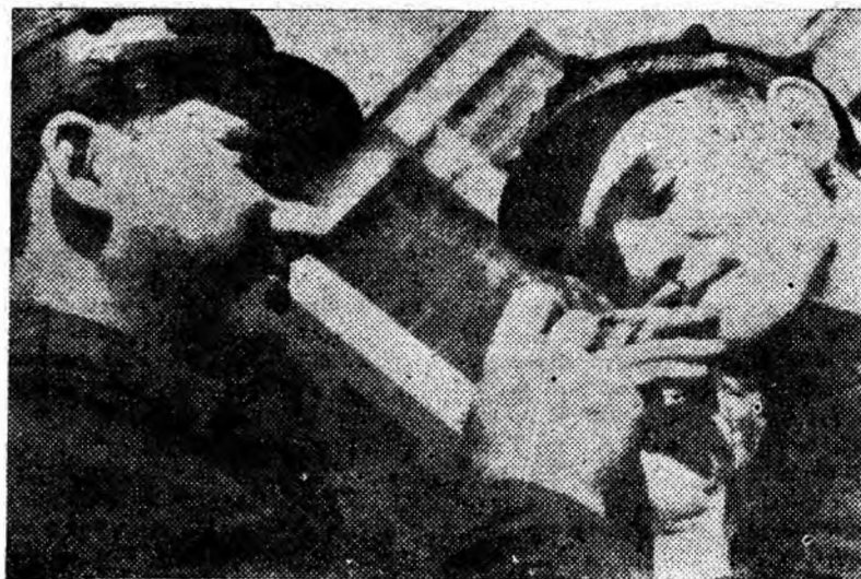
Înainte de intrarea în mină, se aprinde ultima țigară.