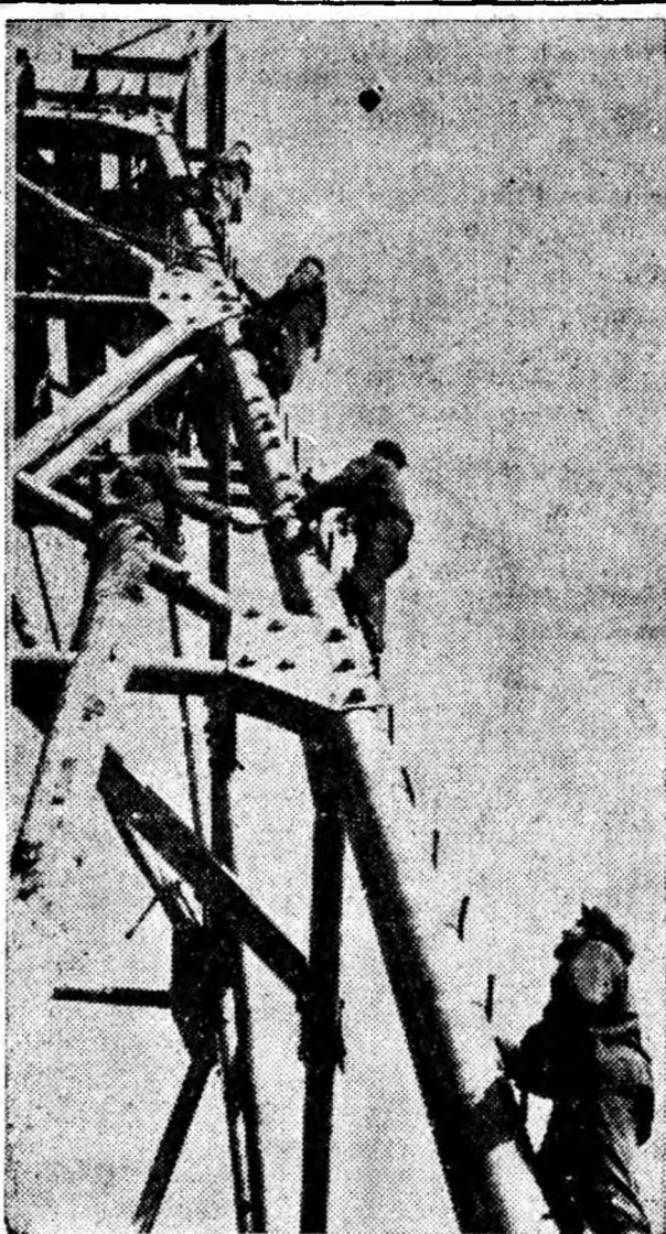
Aninoasa. Pe dealul Lazului se ridică dantelăria de oțel a unui nou puț de mină. IN CLIȘEU: Aspect de la lucrările de montaj.

• La handbal în 7, Știința Petroșani va primi vizita Științei Galați, unde se deplasează fetele noastre de la S.S.E. Meciul începe la ora 11.