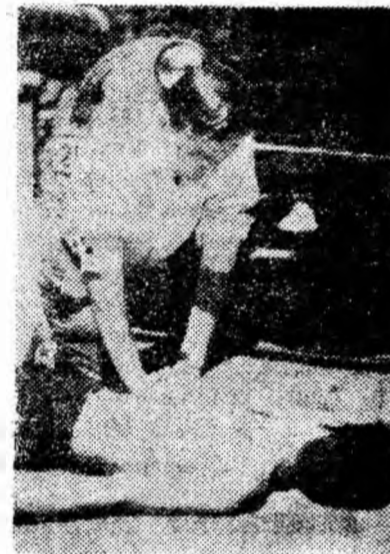
Fig. 6. Cu cele două mîini fixate pe torace reanimatorul execută masajul cardiac extern.

ma în mișcare. Se execută imediat la locul accidentului de către oricine și-a însușit procedul. Metoda constă în a comprima inima între coșul pieptului și coloana vertebrală. Salvatorul aplică amîndouă mîinile pe mijlocul pieptului (treimea inferioară a osului sternal) și apasă puternic și ritmic odată pe secundă, imprimînd feței anterioare a sternu-