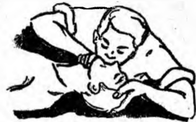
Fig. 5. Reanimatorul insuflă aer prin gura victimei.

MASAJUL CARDIAC EXTERN: Este procedul prin care punem ini-