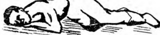
Figura 3. Poziția laterală stabilă (stabilitatea este asigurată prin cotul stîng și ge nunchiul drept).

POZIȚIA BOLNAVULUI. Odată cu pierderea conștiinței, limba victimei cade în fundul gîtului oprind trecerea aerului (fig. nr. 1). Pentru a preveni „înecarea cu limba pro-