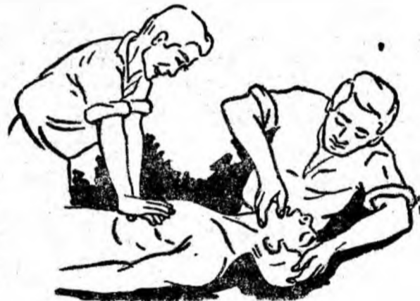
Figura 7. Cele două procedee de reanimare combinate.