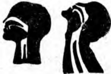
Fig. 1. Limba căzută în fundul gîtului oprește trecerea aerului.

ELIBERAREA CAILOR RESPIRAȚIEI. Accidentatul poate avea în fundul gîtului corp străin, mucozități și sînge care împiedică pătrunderea aerului. Pentru eliberarea căilor respiratorii se vor introduce degetele în gura victimei, se trage limba afară și se curăță cu o batistă cavitatea bucală și fundul gîtului. Nu vom trece la alt procedeu de reanimare pînă nu avem libere căile respiratorii.