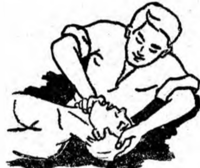
Fig. 4. Reanimatorul inspiră aer adînc.

Poziția pe spate nu este bună în toate cazurile deoarece căile respiratorii pot fi astupate nu numai prin înghițirea limbii ci și prin acumularea în cavitatea bucală și în căile respiratorii de sînge, mucozități și corpuri străine. În asemenea cazuri se recomandă poziția laterală stabilă (fig. nr. 3).