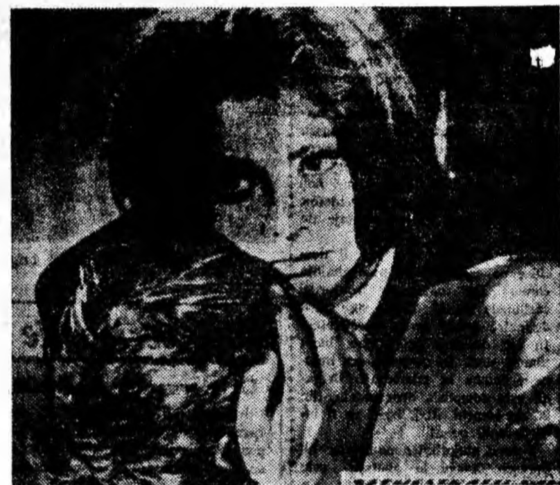
O scenă din filmul „Sechestratul din Altona”.

Filmul „Sechestratul din Altona” este o producție italo-franceză. În rolurile principale: Sophia Loren și Friederic Marek, (cunoscut din fil-