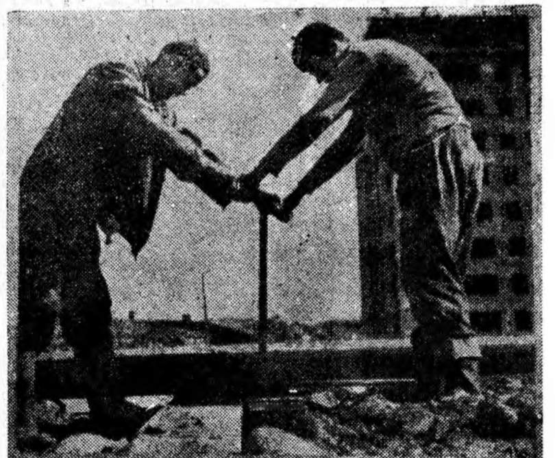
Pentru începerea gîsării celui de-al 4-lea bloc cu 8 etaje — D 13 — pe șantierul Vulcan se fac numeroase pregătiri. Iată în clișeu pe tov. Negrea Nistor lucrînd împreună cu un ortac al lui la montarea săii de rulare pentru macara.