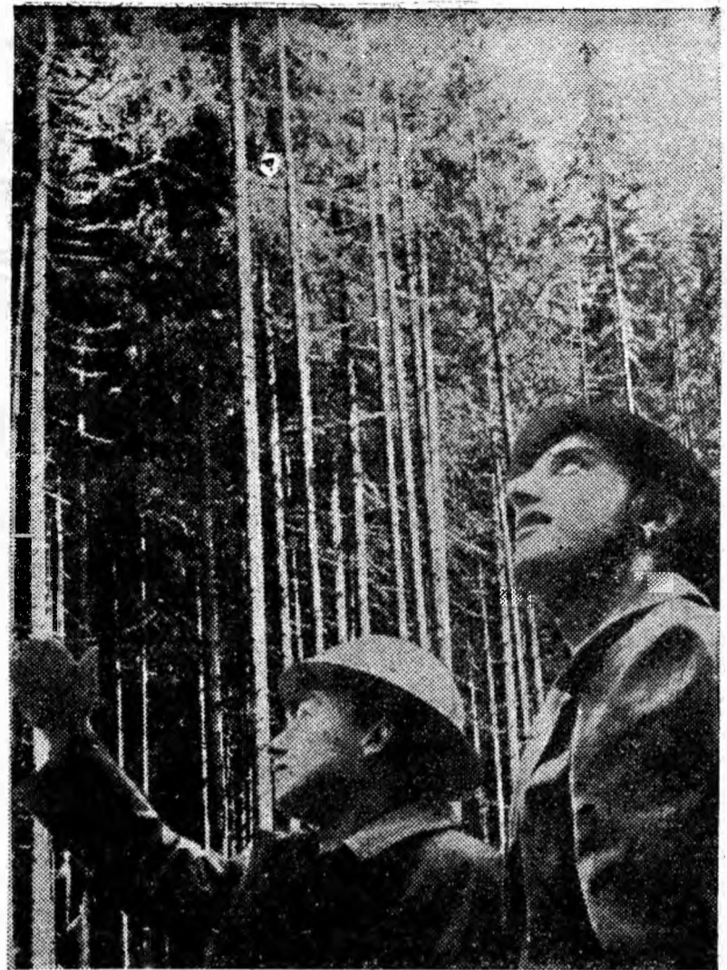
Aurul verde al pădurilor așteaptă pe harnicii forestieri spre a le dăruia comorile ei.

După examinarea personalului tehnic va fi organizată o largă acțiune de reîmprospătare a cunoștințelor de tehnica securității și protecția muncii în rândurile tuturor lucrătorilor întreprinderii „Viscoza”.