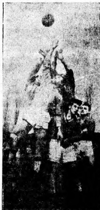
Întîlnirea de rugbi dintre Știința Petroșani și Grivița Roșie din București a abundat în faze ce au încîntat pe spectatori. Duelul aerian pentru balon e doar una din ele.