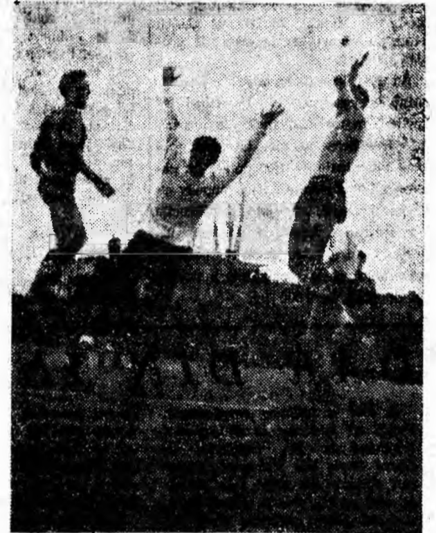
Atac la poarta echipei Steaua.

În repriza secundă gazdele intră pe teren hotărâte să schimbe rezul-