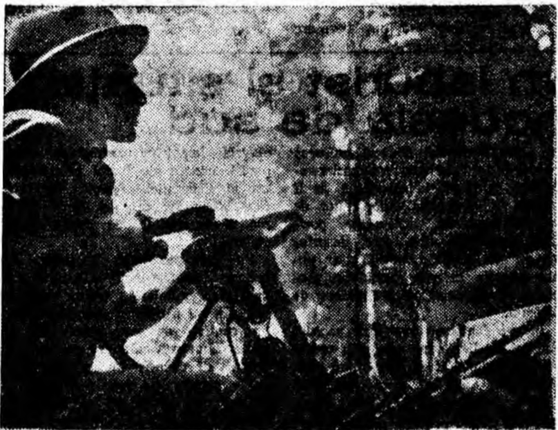
Fierăstrăul mecanic — această minunată unealtă modernă a muncitorului forestier de azi — taie cu mare ușurință uriașul copac!

PETROȘANI — 7 NOIEMBRIE: Dragoste la zero grade; REPUBLICA: Rebelul magnific; PETRILA: Electra; ISCRONI: Păpușile rid; VULCAN: Vichingii; CRIVINDA: O perlă de mamă; PAROȘENI: Nori albi; LUPENI — MUNCITORESCU: Nu se poate fără dragoste; CULTURAL: Lumea comică a lui Harold Lloyd; BĂRBĂTENI: Împărăția oglinzilor strălucite; URICANI: Valea vulturilor.