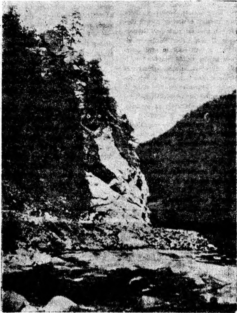
Vedere de toamnă din apropiere de Gura Apei. Masivul Retezat.

grohoțișurile căldurilor glaciale, apar seară de seară în jurul lacurilor. În mîna amatorilor de inedit aparatele fotografice percutează neîntrerupt. Natura, schimbînd de la o zi la alta aspectul acestor locuri abia dacî le permite să imprime pe peliculă săl-