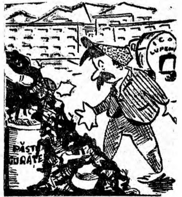
Din cauză că mașina de la I.C.O. nu vine cu regularitate să ridice gunoii din cartierul Viscoza Lupeni, cutiile special amenajate în acest scop devin neîncăpătoare.

După vindecarea plăgii de pe corneă, agrafele sînt scoase cu un instrument special.