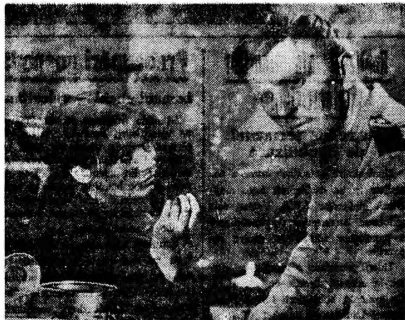
ÎN CLIȘEU: O secvență din filmul „Unde-i generalul”, o producție a studiourilor poloneze ce va rula pe ecranul cinematografului „7 Noiembrie”.

Pentru calitățile remarcabile, pentru interpretare excepțională filmul a fost distins cu mai multe premii la Festivalul Internațional al filmului de la Mar del Plata 1963: „Premiul special al festivalului”, „Premiul criticilor pentru cel mai bun film”; actorul Tom Courtenay (interpretul principal) — „Premiul pentru cea mai bună interpretare masculină” obținînd același premiu și de la Societatea criticilor.