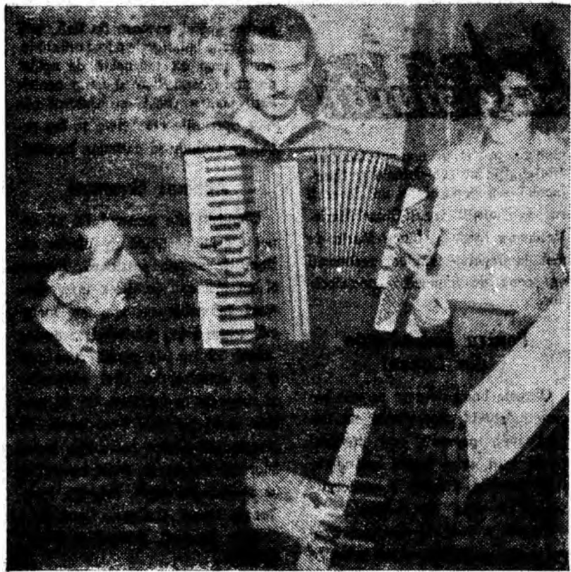
Se pregătește un nou spectacol la clubul sindicatelor din Lupeni.