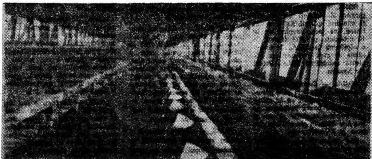
Pe aceste benzi transportoare din preparația Cosoesti cărbunele ieșit din mină face un drum lung la capătul cărui este supus preparării.

PETROȘANI — 7 NOIEMBRIE: Unde-i generalul; REPUBLICA: Singurătatea alergătorului de cursă lungă; PETRILA: Frații corsicani; LIVEZENI: Bătrînul și marea; ANINOASA: Hoțul din San Marengo; VULCAN: Cascada diavolului; LUPENI — MUNCITORESC: Imblinzitorii de biciclete; URICANI: Dragoste lungă de-o seară.