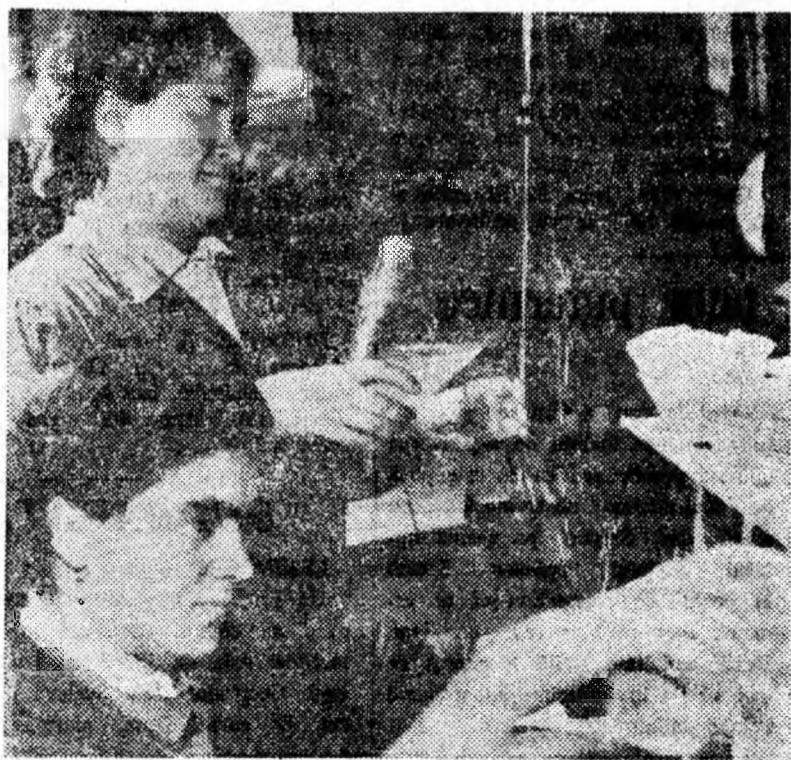
În laboratorul de la preparatia Lupeni: examenul calității cărbunelui.

Caracteristic pentru cuvîntul fiecărui participant la discuțiile din jurul „mesei rotunde” este orientarea spre problemele de perspectivă, grija pentru producția zilei de mine. Propunerile lor au ținut tocmai spre rezolvarea acestor probleme. Rămîne ca la Lupeni, Vulcan și Uricani acestea să fie traduse în fapt. Indicatorii calitativi ce vor fi obținuți în viitor, vor oglindi în ce măsură colectivele acestor exploatarea răspund acestei cerințe alături de actuale pentru economie națională — îmbunătățirea calității cărbunelui cocsificabil.