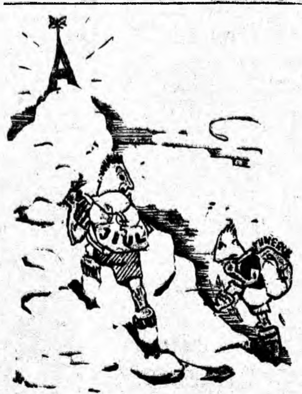
Urscupul e greu dar „plîn” se poate totuși cereci.

Jocul vostru pe deplin În sfîrșit dădu dovadă Că trăgînd la poartă-n „plîn”, Golurile-au curs... grămadă!