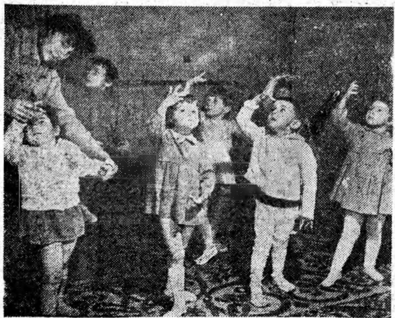
Primele noțiuni de artă.

Duminica trecută în toată țara s-a deschis sezonul de vînătoare. Cu acest prilej Asociația orășenească a vînătorilor și pescarilor sportivi din Petroșani a organizat o vînătoare colectivă. Un număr de 75 de vînători s-au deplasat cu trenul la Bretea Streiului și Cîrnești. Cei mai norocoși au fost vînătorii din grupul celor care au scotocit împrejurimile comunei Cîrnești. Ei au împușcat 31 de iepuri.