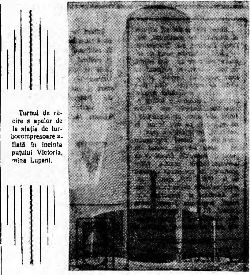
Turnul de răcire a apelor de la stația de turbocompresoare aflată în incinta puțului Victoria, mina Lupeni.