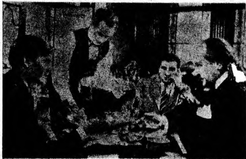
O secvență din film

Acesta este tabloul sumar în care se desfășoară acțiunea filmului avînd