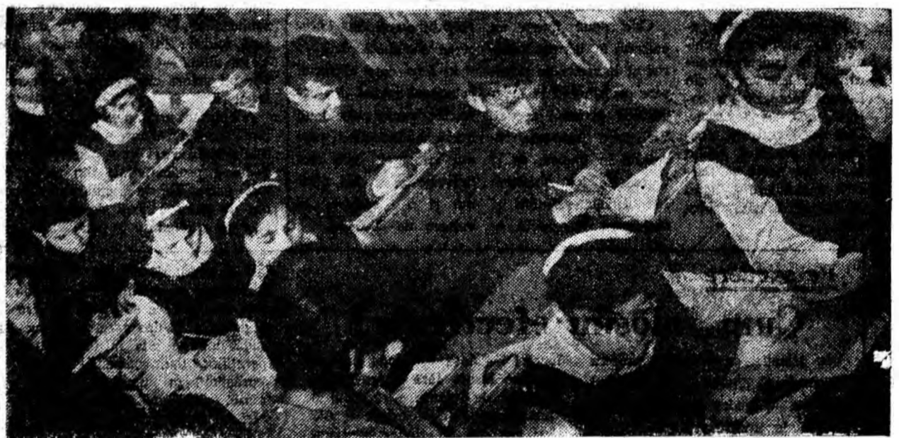
Notînd cu atenție explicațiile profesoarei, elevii clasei a IX-a A de la Școala medie din Lupeni se străduiesc să pătrundă înțelesul lecției încă de la predare.