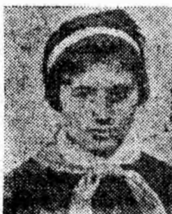
GIRIPERU VETURIA clasa a VII-a Școala medie Petrița