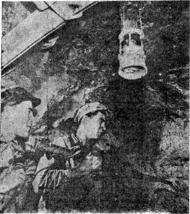
La unul din fronturile minei Dîlja se execută perforarea.

Anul XVI XXI Nr. 4707 Sâmbătă 5 decembrie 1964 4 pag. 20 bani