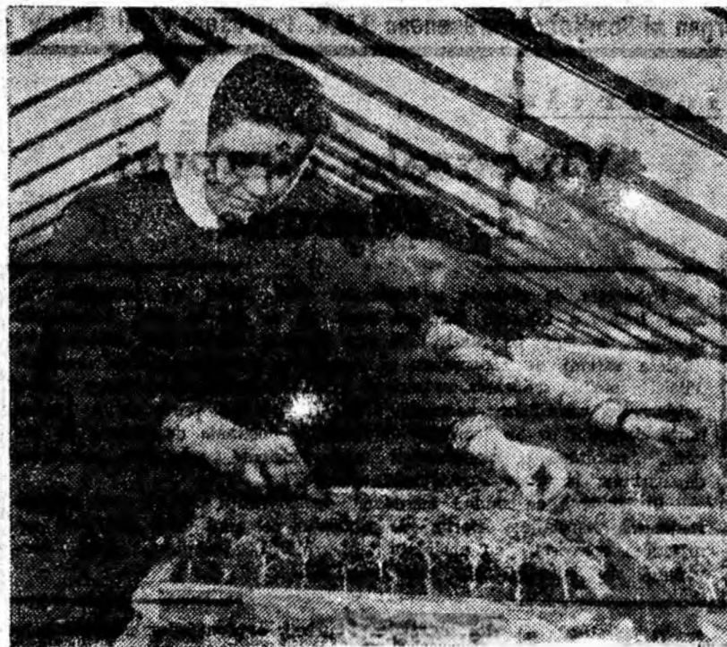
Florile, care în primăvara anului viitor vor fi plantate în parcuri, pe zonele verzi din jurul noilor blocuri, sînt pregătite cu migală încă de pe acum.

IN CLIȘEU: Aspect interior al serei de flori din orașul Petrila.