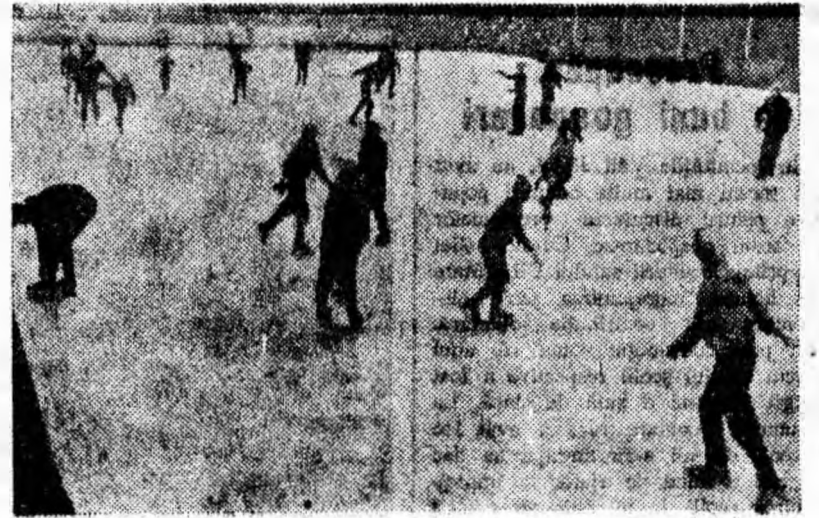
Bucuroși de timpul friguros patinatorii alunecă cu viteză pe lucrul gheții

Complet reamenajat și bine iluminat, patinoarul atrage numeroși iubitori ai hocheiului și patinajului.