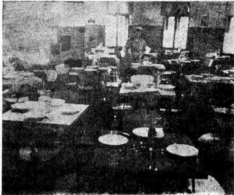
Ordine, curățenie, aspect plăcut — iată ce caracterizează sala de mese a Școlii profesionale din Petroșani.

Lucrările efectuate, cit și dotarea unităților de frizerie, mai sus amintite, cu mobilier modern, au schimbat vechea înfățișare a acestora, înfrumusețîndu-le.