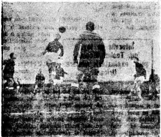
O fază din meci

tină victoria, cu 3-2, printr-un plus de voință și combativitate.