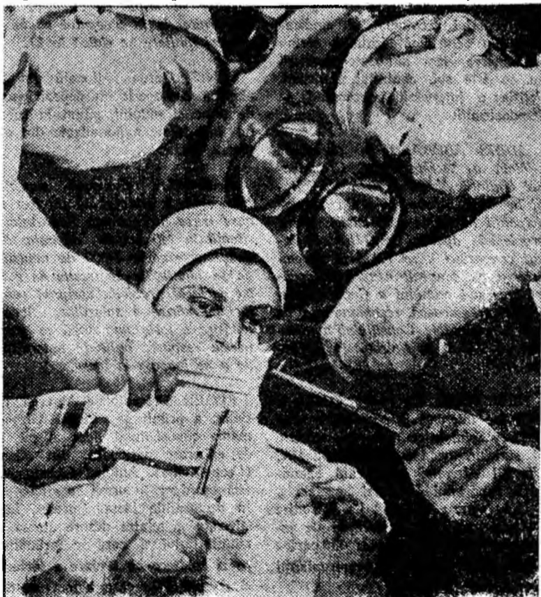
Pregătiri pentru o nouă intervenție chirurgicală la Spitalul unificat din Lupeni.