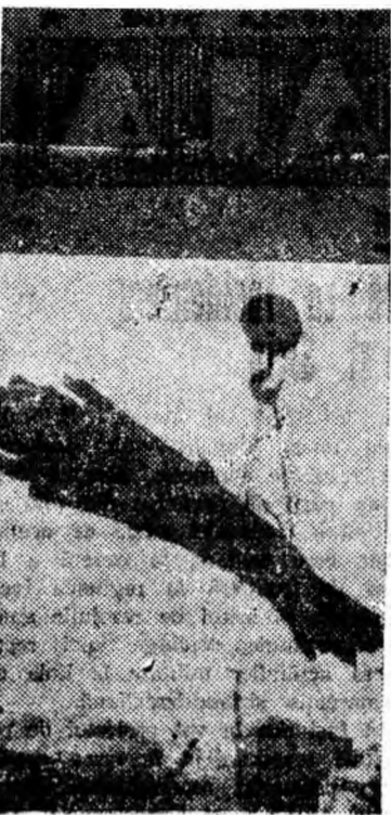
U.R.U.M.P. Se descarcă un nou lot de laminate pentru armăturile metalice de mină.

Cererile de angajare se depun la sediul întreprinderii I.C.I.L. Simeria, str. Tralan nr 88, telefon 29.