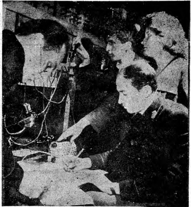
Studentii în laboratorul electric.

Cu asemenea oameni, nu-i de mirare că în acest an, colectivul secției reparații mecanice de la U.R.U.M. Petroșani a primit de două ori steagul de secție evidențiată în întrecerea socialistă pe uzină". R. BALȘAN corespondent