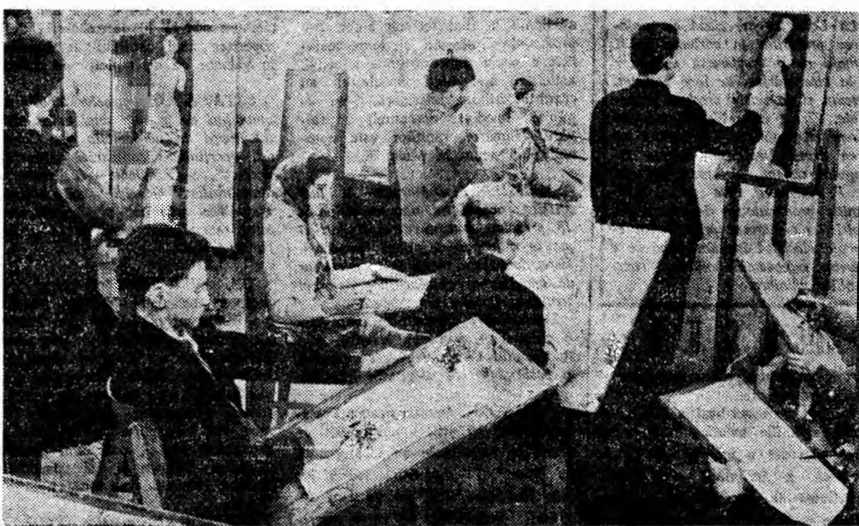
Școala populară de artă din Petroșani — secția artă plastică. Cîțiva elevi din anii I, II, III în fața șevalelor.