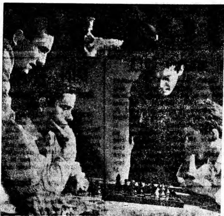
După orele de curs, puțină destindere nu strică. O partidă de șah între colegi oferă studenților (în clădirea) posibilitatea să-și petreacă plăcut timpul liber.