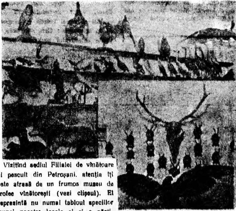
Vizitînd sediul Filialei de vînătoare și pescuit din Petroșani, atenția țîi este atrasă de un frumos muzeu de trofee vîntoarești (vezi clipoul). El reprezintă nu numai tabloul speciilor faunei noastre locale ci și o pîrticică din truda depusă pentru bertonirea, înmulțirea și valorificarea rațională a acestei bogății.

D.C.A.-ului 1800 bucăți blănuri mari și peste 1600 kg carne de vînă.