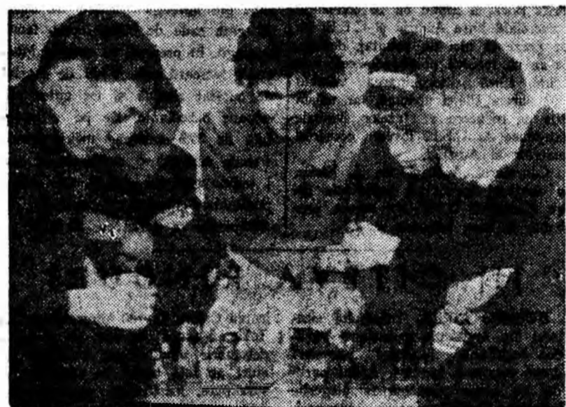
În zilele de vacanță, la o partidă de șah