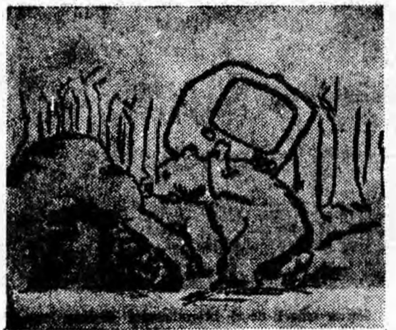
Pregătiri de hibernare („Ogonick”)

— Nu stau de vorbă cu coșurile de gunoi, răspunde cu promptitudine contravenienta.