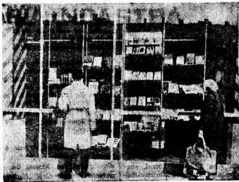
Au sosit noutăți în librărie