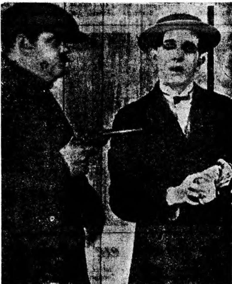
O secvență din filmul