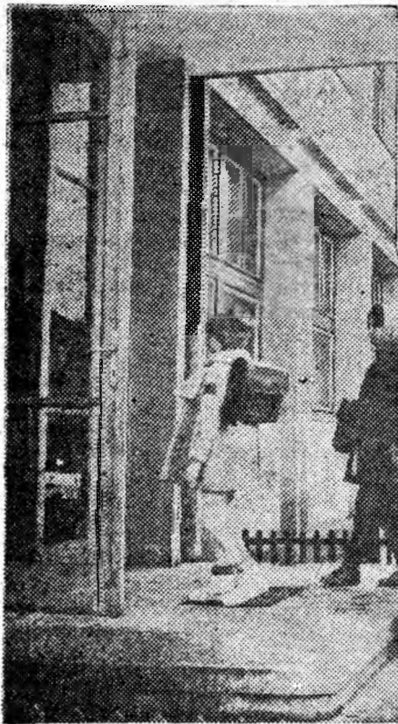
Prima zi de școală din trimestrul II

A mîncat grăbită și a plecat spre școală.