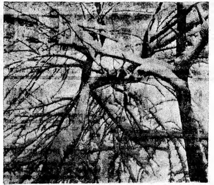
Arborii au îmbrăcat mantie de iarnă. Asemenea frumuseți se pot vedea însă acum doar urcînd pe înălțimi.