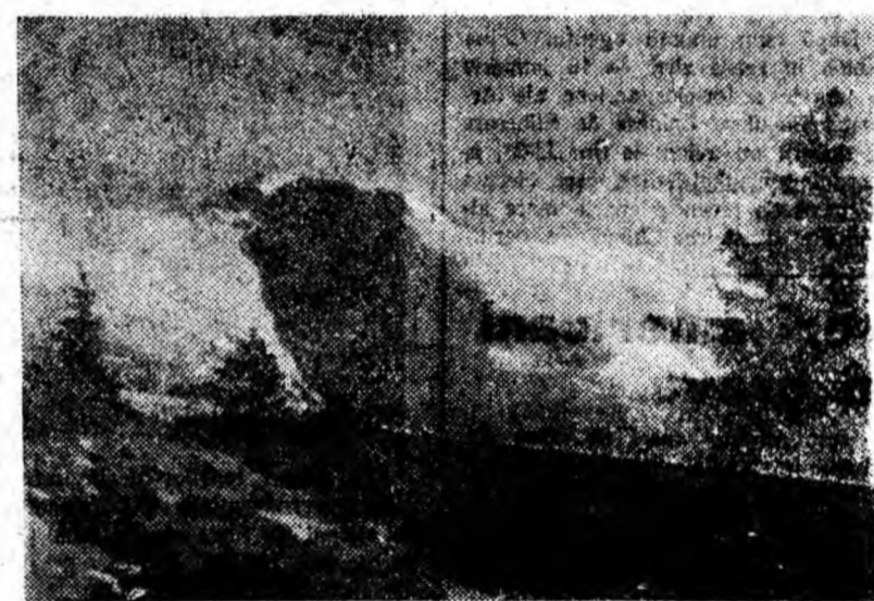
Vedere spre Paring