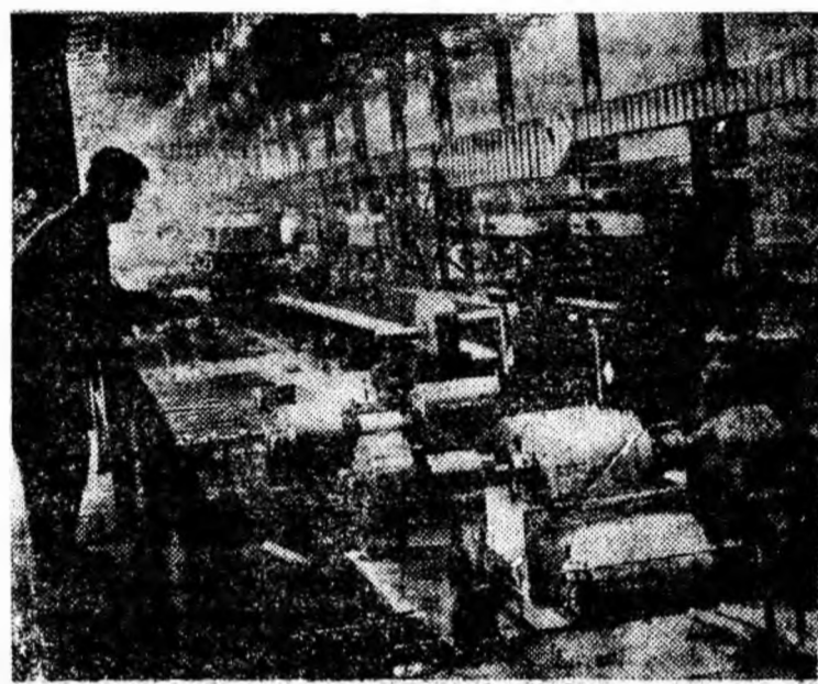
O imagine grăitoare despre impetuoasa dezvoltare a cetății oțelului de la Hunedoara. Fotografia înfățișează noile laminoare de la combinatul siderurgic — linia continuă de semifabricate.