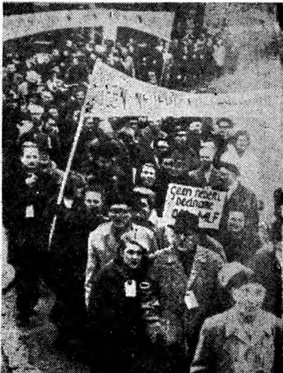
La Amsterdam a avut loc de curînd o demonstrație a partizanilor păcii din Olanda, la care au participat 15 000 de persoane. Participanții la demonstrație, reprezentanți ai luptătorilor pentru pace din întreaga Olandă, s-au pronunțat împotriva planurilor de creare a forțelor nucleare multilaterale ale N.A.T.O. și împotriva participării Olandei la aceste forțe.

de acuzare împotriva foștilor conducători sudanezi. Ministrul însărcinat cu afacerile Consiliului de Miniștri, El Ahmed, a declarat reprezentanților presei că „membrii fostului consiliu suprem militar au încălcat constituția și au înlăturat guvernul legal al Sudanului la 16 noiembrie 1958”. Ministrul a adăugat că „toți cei care au colaborat cu șefii militari pentru suprimarea democrației în Sudan vor trebui să fie judecați”.