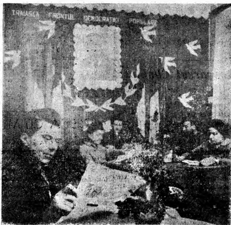
În clișeu: Aspect interior de la Casa alegătorului din stația C.F.R. Petroșani.

• Să realizeze economii suplimentare de 50 000 lei la prețul de cost.