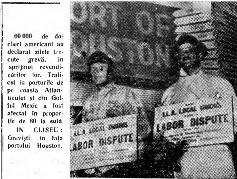
60 000 de docheri americani au declarat zilele trecute grevă, în sprijinul revendicărilor lor. Traficul în porturile de pe coasta Atlanticului și din Golful Mexic a fost afectat în proporție de 80 la sută. IN CLIȘEU: Greviști în fața portului Houston.

În pofida acestor acorduri, greva docherilor continuă deoarece reluarea lucrului urmează să aibă loc doar după reglementarea conflictului în toate porturile. În acest sens agenția Reuter menționează că perspectivele reînnoierii la lucru a celor 60 000 de docheri rămân nesigure din cauza divergențelor locale dintr-un număr de porturi.