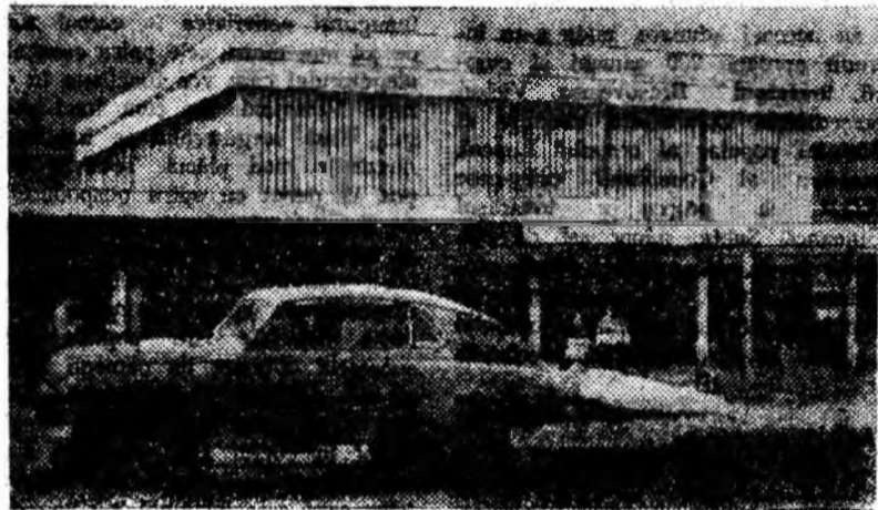
Fotografia ne înfățișează aspectul exterior al noului cinematograful „Culturala” din Lupeni.

Linia arhitecturală modernă, finisajele interioare, cit și aparatele de proiecție noi, asigură condiții optime de vizionare a spectacolelor.