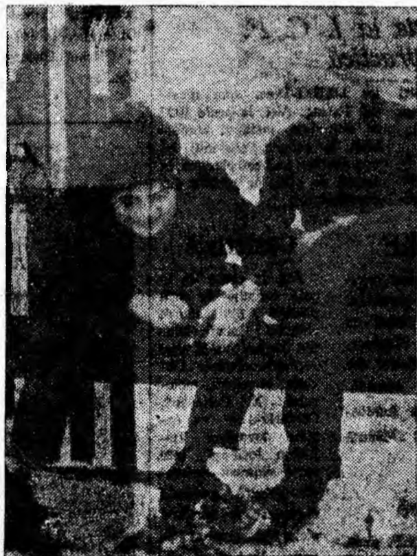
Ultimela pregătiri au fost făcute. Acum la patinoar.