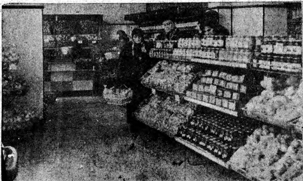
Magazinul O.L.F. cu autoservire deschis ieri în Petroșani se bucură de o mare afliuență de cumpărători. Expuse cu gust, mărfurile, îngrijit ambalate, atrag privirile cumpărătorilor. IN CLIȘEU: Un aspect din magazin.

cu peste 2 700 000 tone de cărbune mai mult decît au dat în 1938 la un loc toate minele de cărbuni din țară. Siderurgiștii de la Hunedoara și Călan au produs în 1964 de peste 10 ori mai multă fontă și de peste 7 ori mai mult oțel decît s-a realizat în România în 1938. Din întreaga producție a țării, 52 la sută cărbune, 67 la sută fontă, 63 la sută oțel, 49 la sută laminate, 65,6 la sută minereu de fier,