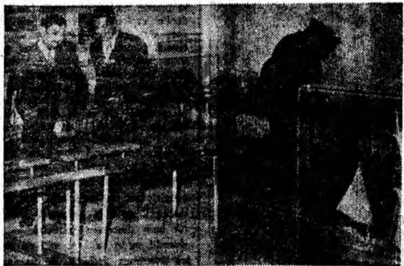
Aspect din sala Muzeului.