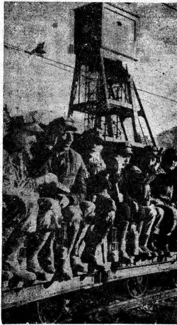
Aspect cotidian de la mina Lupeni. Minerii pornesc spre adâncuri.