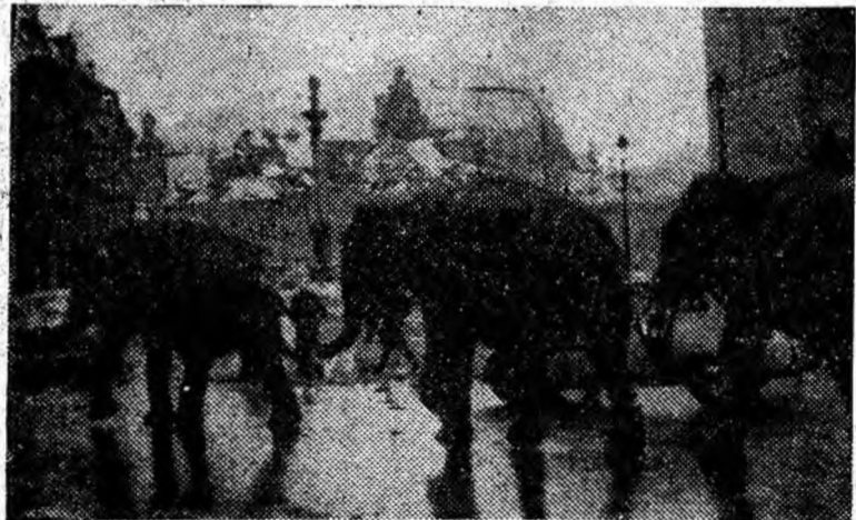
R. P. POLONA. Elefanți aparținînd Circului internațional, într-o cavalcadă originală pe una din străzile principale ale Varșoviei.

PHENIAN 30 (Agerpres). Una din principalele sarcini ale planului economiei naționale a R.P.D. Coreene pe 1965 este creș-