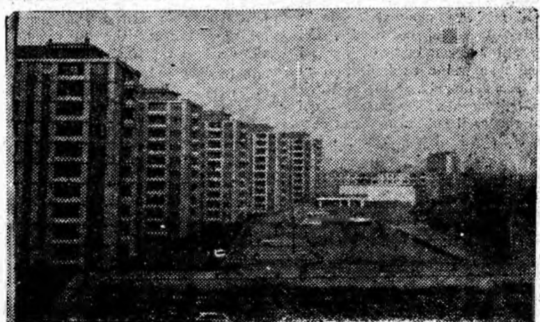
Noile construcții de locuințe date anul trecut în folosință în orașul Onești, regiunea Bacău.

• Pentru ocrotirea sănătății oamenilor muncii, în regiune funcționează peste 189 circumscripții sanitare, 153 case de nașteri și 31 spitale. Au fost alocate pentru ocrotirea sănătății în ultimii 5 ani peste 612 milioane lei. S-au construit noi policlinici la Suceava, Gura Humorului, Dorohoi, Săveni, iar în acest an vor fi terminate o policlinică la Fălticeni și un spital modern cu 600 paturi la Suceava. (Agerpres)