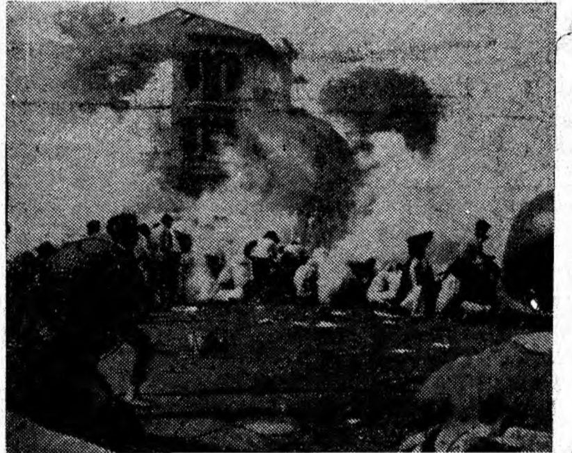
Aspect de la o recentă demonstrație a budiștilor din Saigon, care a fost împrăștiată de poliție cu bombe lacrimogene.

După cum s-a anunțat oficial la Washington, scopul vizitei lui Bundy la Saigon este de a avea consultări cu ambasadorul S.U.A., Maxwell Taylor, care nu se poate deplasa la Was-