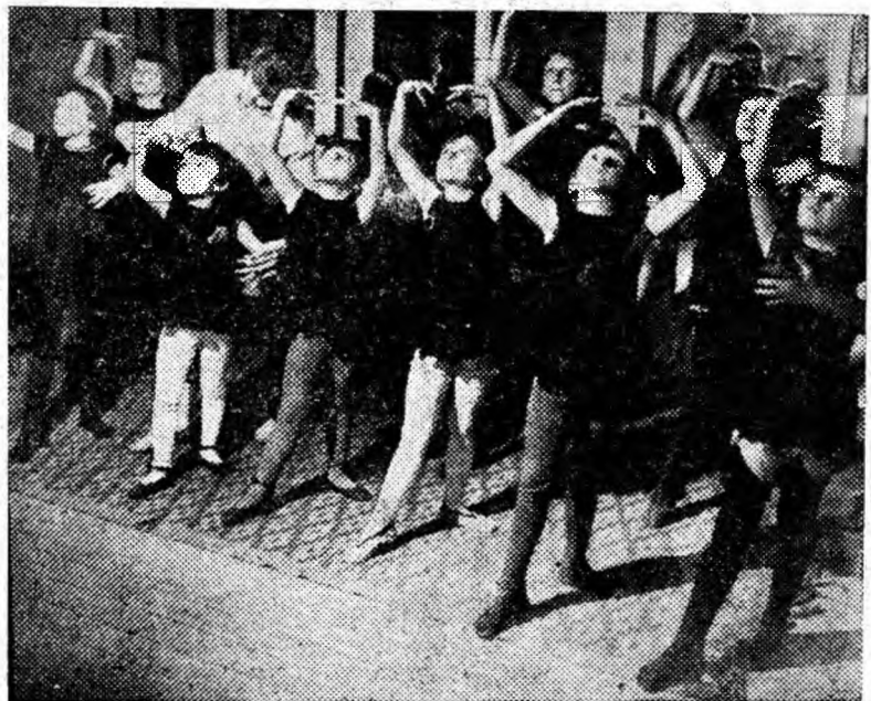
Primii pași în arta baletului.

Iată-i primind pentru a doua oară, consecutiv, insigna de „frunțaș în întrecerea socialistă”.