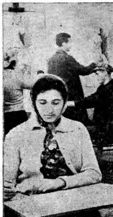
Activitate intensă de creație la cercul de artă plastică din cadrul școlii populare de artă din Petroșani.

⊙ Pe dealul Roșia, ora 9, au loc întreceri de schi pentru sportivi amatori petrițeni, iar la Straja continuă întrecerile dotate cu „Cupa 16 Februarie”.