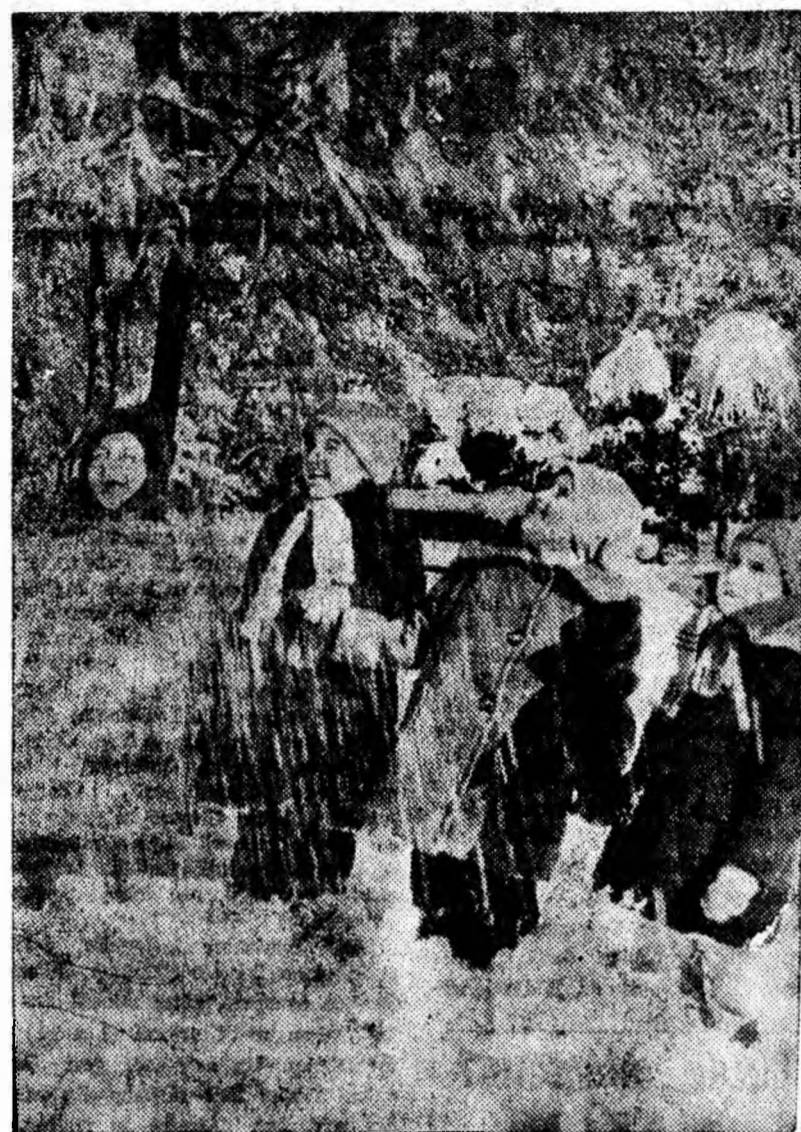
A început din nou să aingă. Copiii prînesc evenimentul cu multă bucurie.

Dr. Angervo susține că Napoleon a mințit în legătură cu campania din Rusia și că înfrîngerea sa a fost provocată de grave greșeli tactice și nu de „generalul iarnă”, deoarece în 1812 iarna rusească a fost destul de blîndă. Meteorologul finlandez afirmă că a descoperit minimele de temperatură înregistrate în acel an de-a lungul itinerariului parcurs de armata lui Napoleon de la 19 octombrie pînă la sfîrșitul lui noiembrie. În nici-o regiune temperatura nu a coborît sub zero grade. Deci, rămășițele armatei franceze, n-au putut trece Berezina în cursul nopții de 27 spre 28 noiembrie 1812, mergînd pe gheață, dat fiind că nu existau decît câteva slo-turi duse de curent.