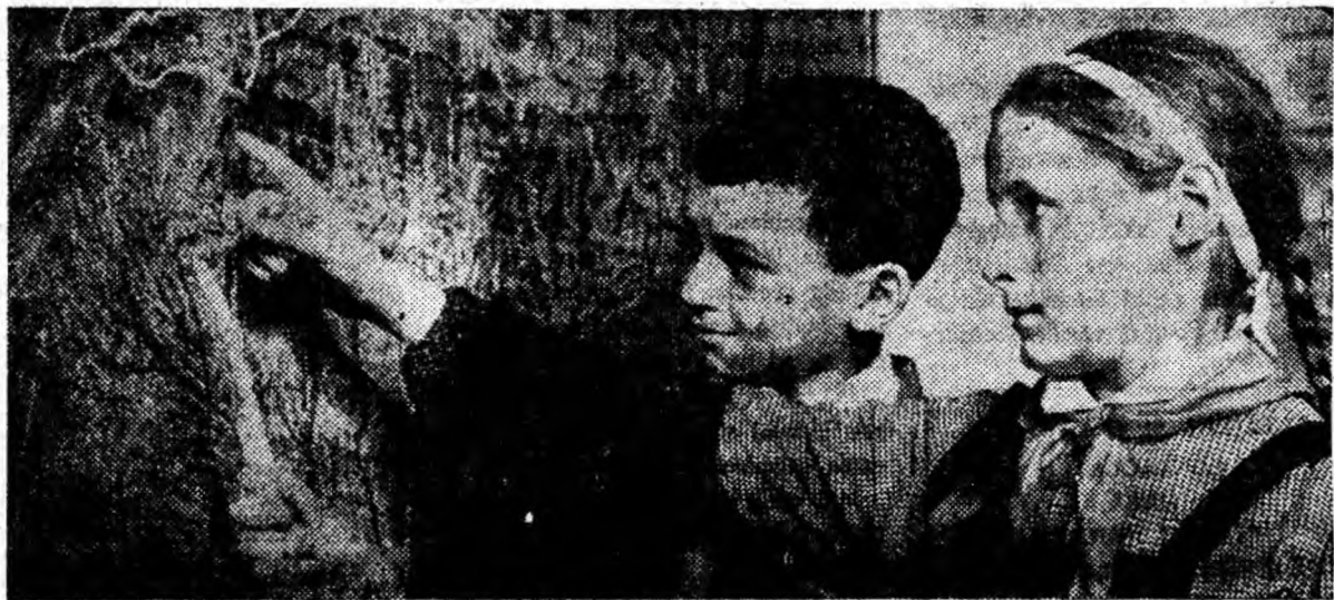
Oră de geografie la clasa a IV-a de la Școala generală de 8 ani din Iecroal.

De asemenea volumul mai cuprinde următoarele materiale: mici experiențe distractive, mic dicționar de termeni științifici, indice de nume.