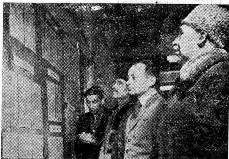
Aspect de la centrul de afișare a listelor de alegători de la Sfatul popular al orașului Petroșani.

CETAȚENI ȘI CETAȚENE! CONTROLAȚI DACA SINTEȚI INSCRIȘI PE LISTELE DE ALEGĂTORI!