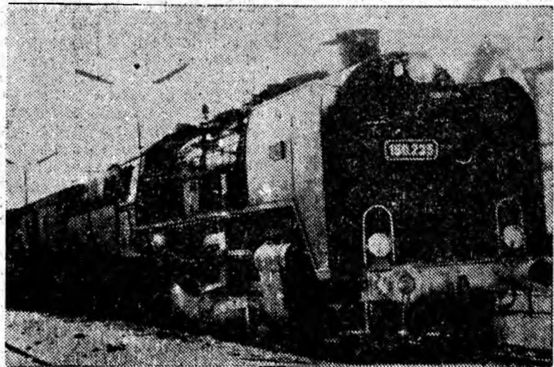
Un nou tren gata de plecare din stația C.F.R. Petroșani.

⊙ Școala de 8 ani de muzică și arte plastice din Petroșani prezintă azi, la ora 17,30, în sala Teatrului de stat din Petroșani, un recital de muzică instrumentală. Recitalul cuprinde bucăți din creația compozitorilor Beethoven, Mozart, Diabelli, Kuhlman etc.