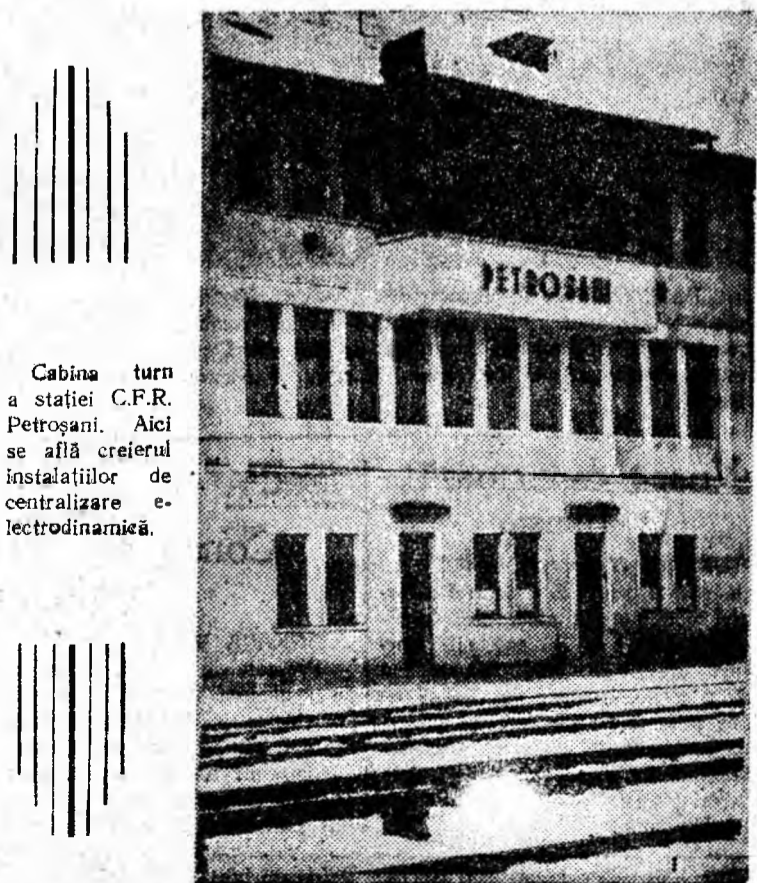
Cabina turn a stației C.F.R. Petroșani. Aici se află creierul instalațiilor de centralizare electrodinamică.

Zi de zi, harnicii ceferiști din Valea Jiului își aduc din plin contribuția la dezvoltarea continuă a economiei naționale, la înflorirea patriei noastre dragi.